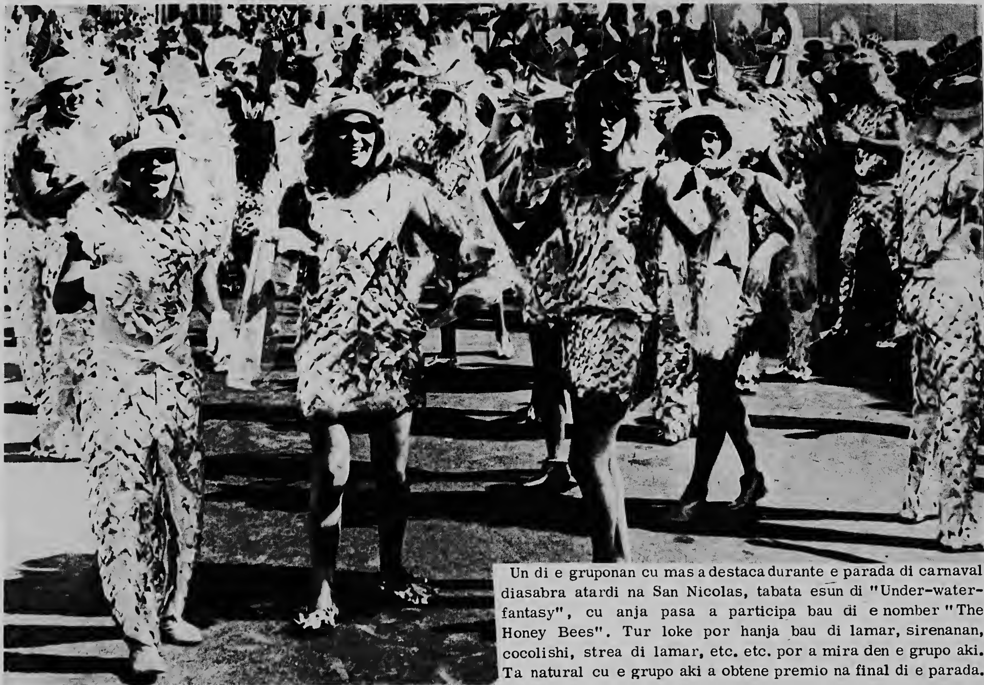
Un di e gruponan cu mas a destaca durante e parada di carnaval diasabra atardi na San Nicolas, tabata esun di "Under-water-fantasy", cu anja pasa a participa bau di e nomber "The Honey Bees". Tur loke por hanja bau di lamar, sirenanan, cocolishi, strea di lamar, etc. etc. por a mira den e grupo aki. Ta natural cu e grupo aki a obtene premio na final di e parada.